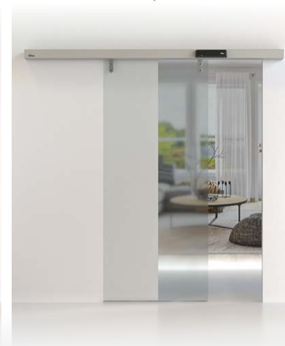
PORTA SCORREVOLE CIVIK E DAS