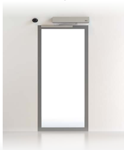
PORTES BATTANTES DAB ET SPRINT