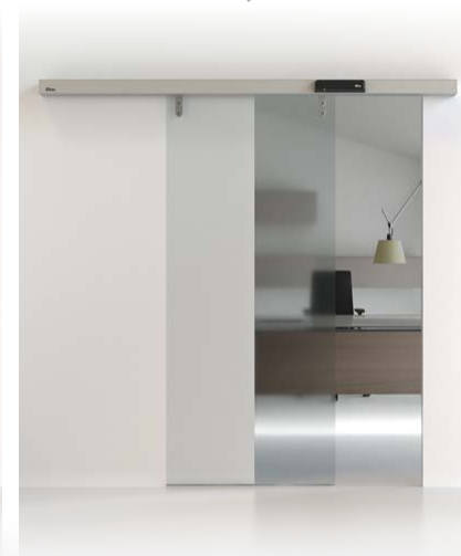
PORTES COULISSANTES CIVIK AND DAS