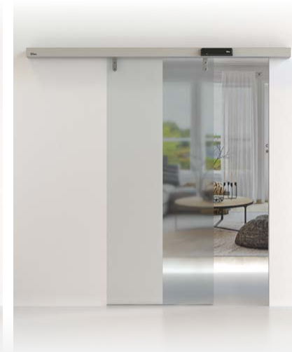
PUERTAS CORREDERAS CIVIK Y DAS