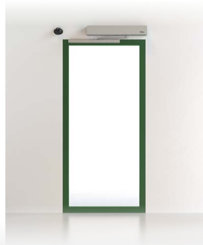
PUERTAS BATIENTES DAB Y SPRINT