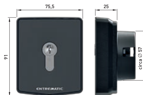
AXK5I - AXK5NI (versione senza cilindro)