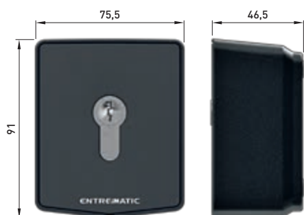
AXK5M - AXK5NM (versione senza cilindro)