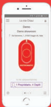
aplicación SCLAK iOS 9+ y Android 4.3.1+

(2) Descargar la App SCLAK de las tiendas Apple o Google