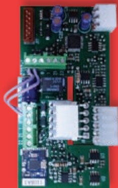
tarjeta electrónica enchufable compatible con todos los cuadros Entrematic

(1) Instalar la tarjeta electrónica (MOBCRE) en los conectores de accesorios de los cuadros de control Entrematic o en la base porta-tarjetas CONT1