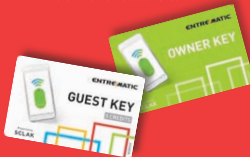
credenciales de propietario e huésped

En caso de que se necesiten varias credenciales de acceso, hay tarjetas Entrematic disponibles con códigos de activación adicionales