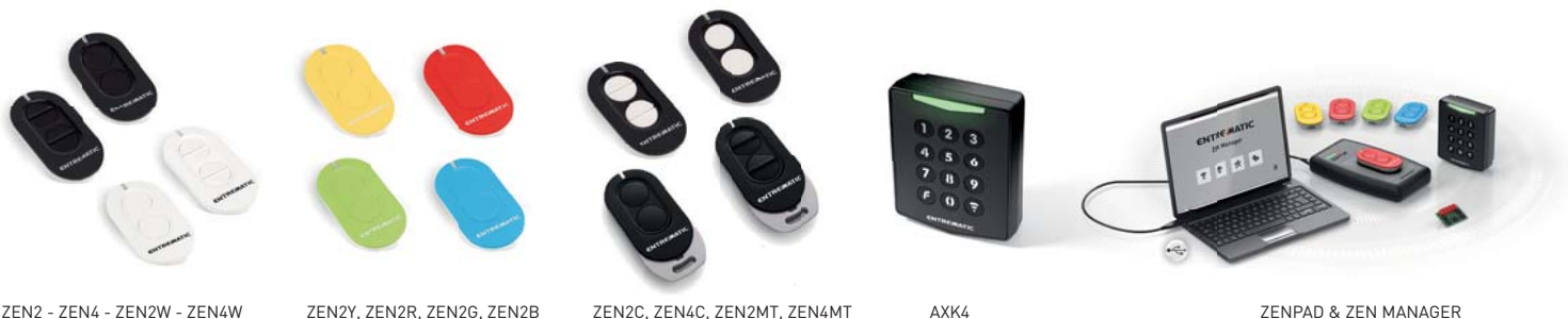
ZEN2 - ZEN4 - ZEN2W - ZEN4W